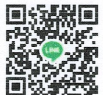
ไลน์กลุ่มสัมภาษณ์ วฐ.